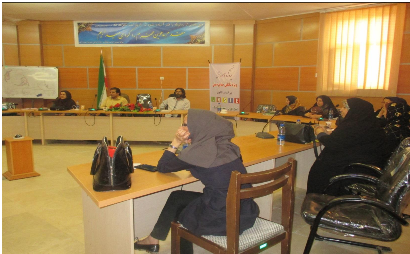
دوره جناب آقای مهندس مریخی - جلسه پرسش و پاسخ مسئولین