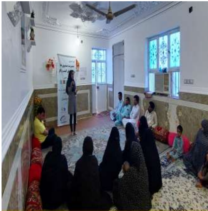
جلسه آموزش مهارت‌های زندگی و کسب و کار بر اساس الگوی LNSIE اعضای صندوق خرد روستای حاجی آباد شهرستان سرپاز - مهرماه 1401