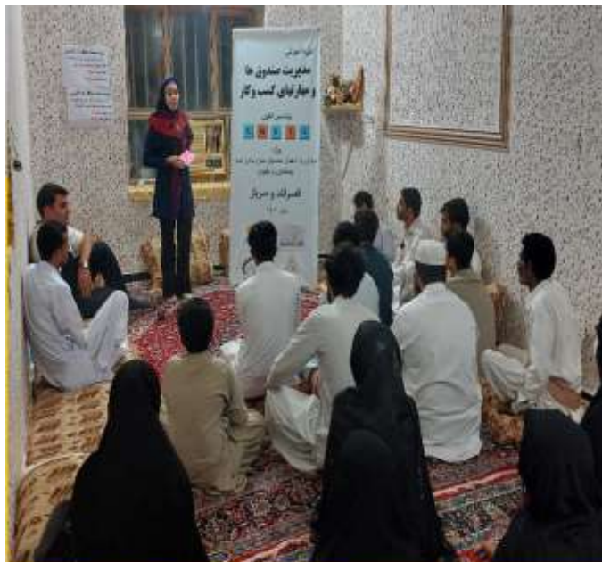
دوره آموزش مهارت‌های زندگی و کسب و کار بر اساس الگوی LNSIE اعضای صندوق های مالی محلات گونگان و قلعه بازار بصورت مشترک - مهرماه 1401