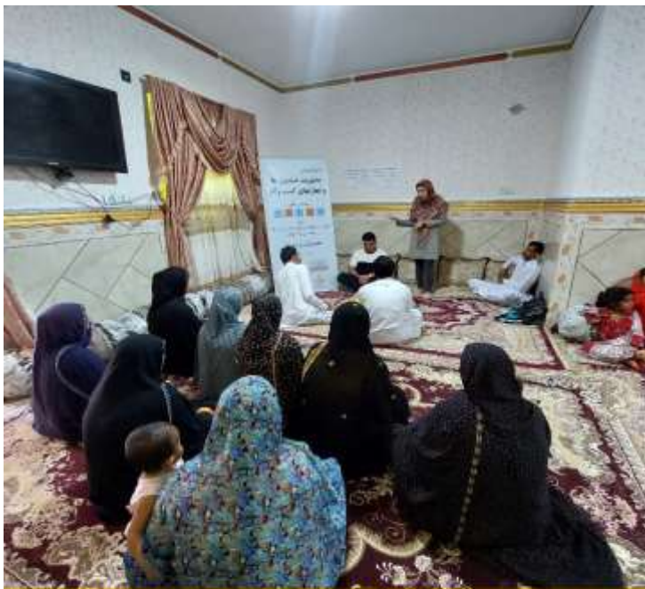
دوره آموزش مهارت‌های زندگی و کسب و کار بر اساس الگوی LNSIE اعضای صندوق مالی خرد روستای حاجی آباد شهرستان قصرقند - مهرماه 1401