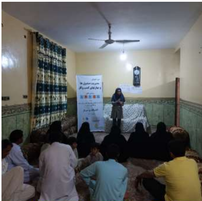
دوره آموزش مهارت‌های زندگی و کسب و کار بر اساس الگوی LNSIE اعضای صندوق مالی خرد روستای بانک شهرستان سرپاز - مهرماه 1401