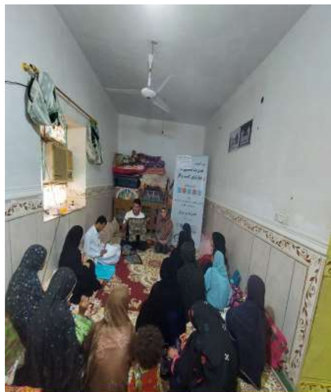
دوره آموزش مهارت‌های زندگی و کسب و کار بر اساس الگوی LNSIE اعضای صندوق مالی خرد روستای دزین شهرستان قصرقند - مهرماه 1401