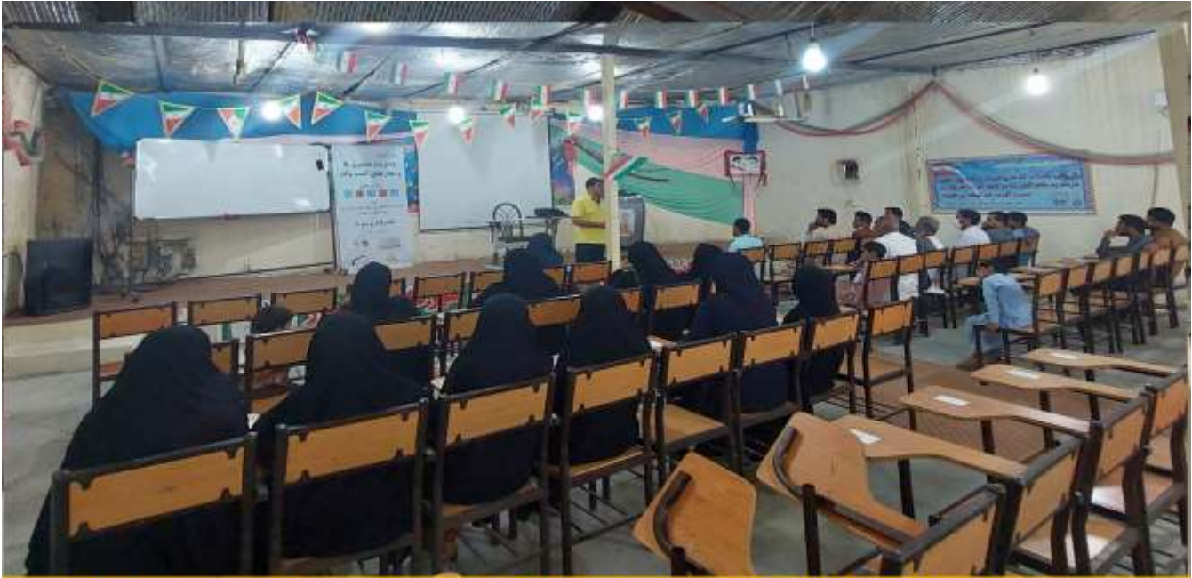
جلسه آموزش ارکان اصلی 10 صندوق تشکیل شده در سرباز - مهرماه 1401 مهارت‌های مدیریت و حسابداری صندوق های خرد روستایی