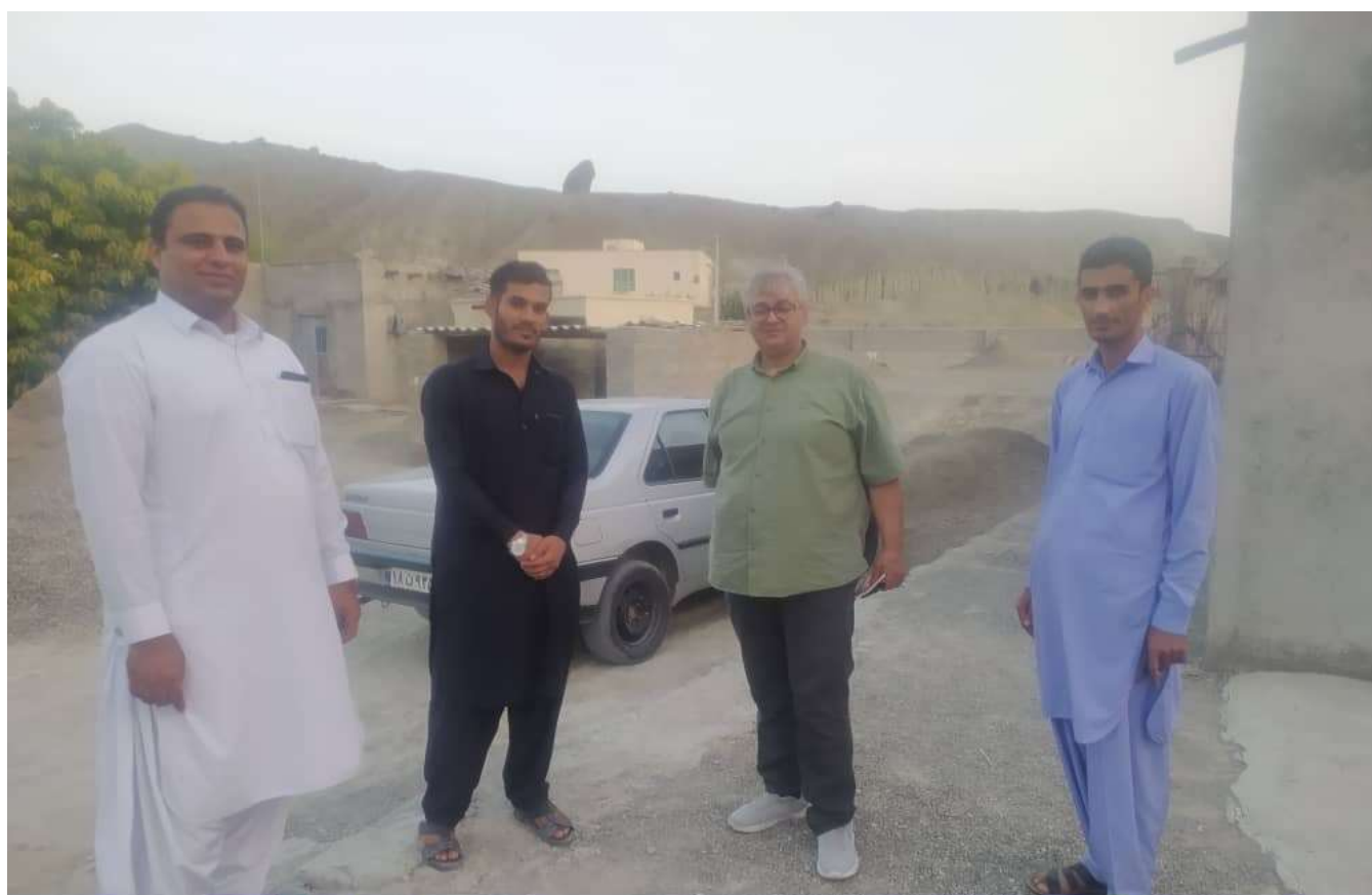
بازدید میدانی از محلات محروم به همراه اعضای شورای شهر قصرقند مرداد 1401