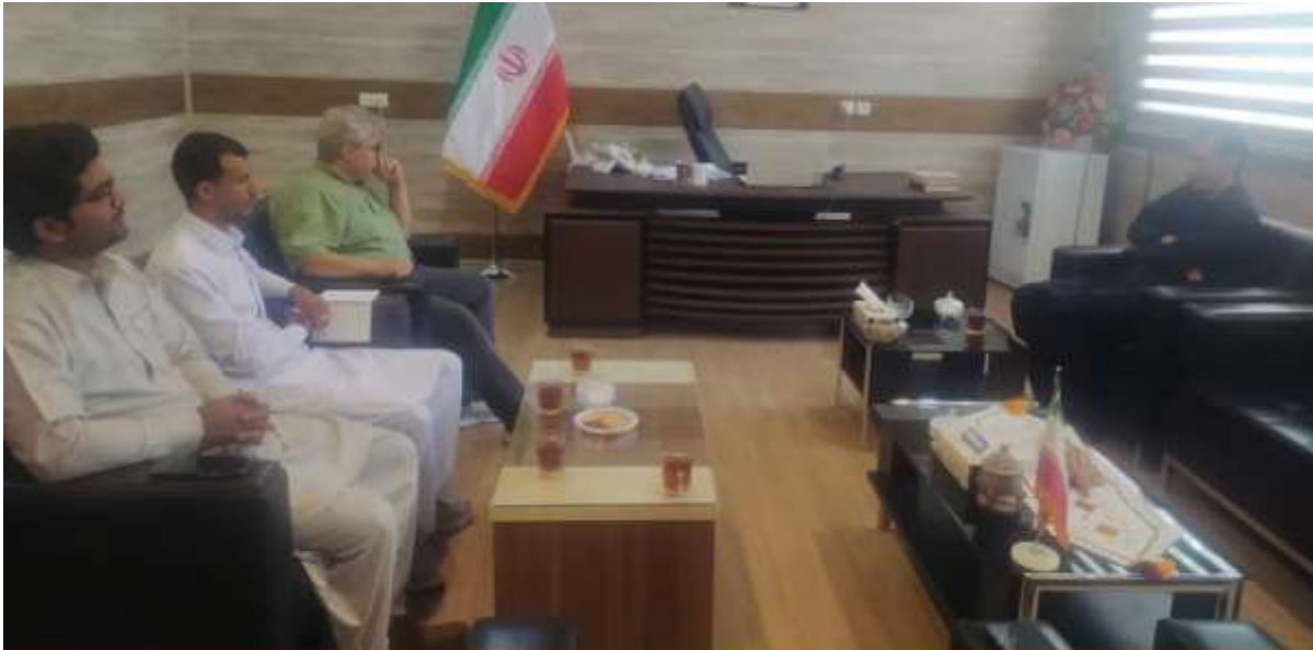
جلسه با فرماندار شهرستان سرباز و بررسی روستاهای هدف و خوشه های پیش بینی شده شهریور 1401