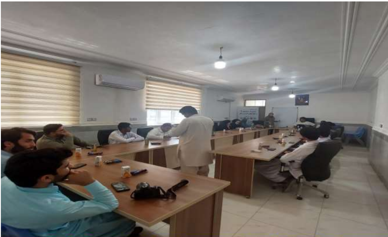
جلسه آموزش ارکان اصلی 15 صندوق تشکیل شده در قسرقند آموزش مهارت‌های مدیریتی و حسابداری صندوق ها - مهرماه 1401