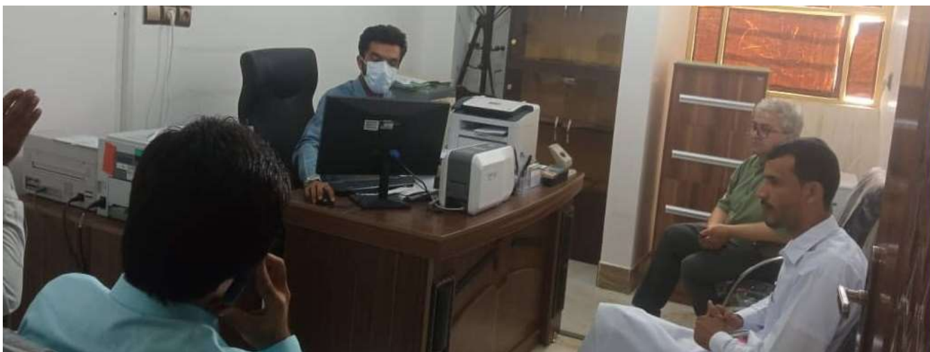
جلسه با رئیس صندوق کارآفرینی امید سرپاز در خصوص بررسی روند افتتاح حسابها و تشریح شیوه نامه تسهیلات صندوق های مالی خرد روستایی به همراه تسهیلگران سرپاز - مرداد 1401