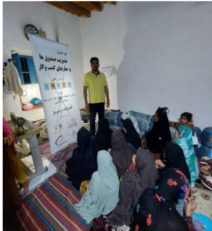
دوره آموزش مهارت‌های زندگی و کسب و کار بر اساس الگوی LNSIE اعضای صندوق مالی خرد روستای گونگان شهرستان سرپاز - مهرماه 1401