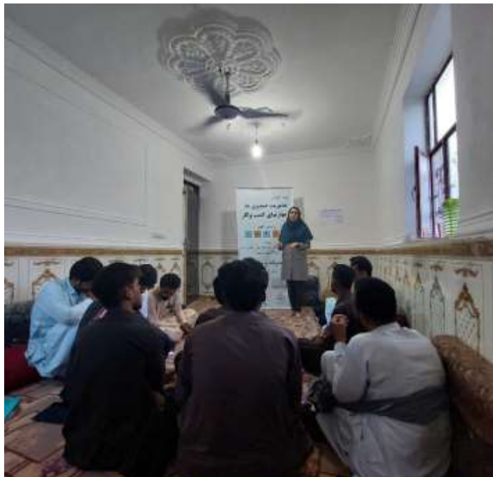
دوره آموزش مهارت‌های کسب و کار و مهارت‌های زندگی بر اساس الگوی LNSIE اعضای صندوق مالی خرد روستای برکان شهرستان سرپاز - مهرماه 1401