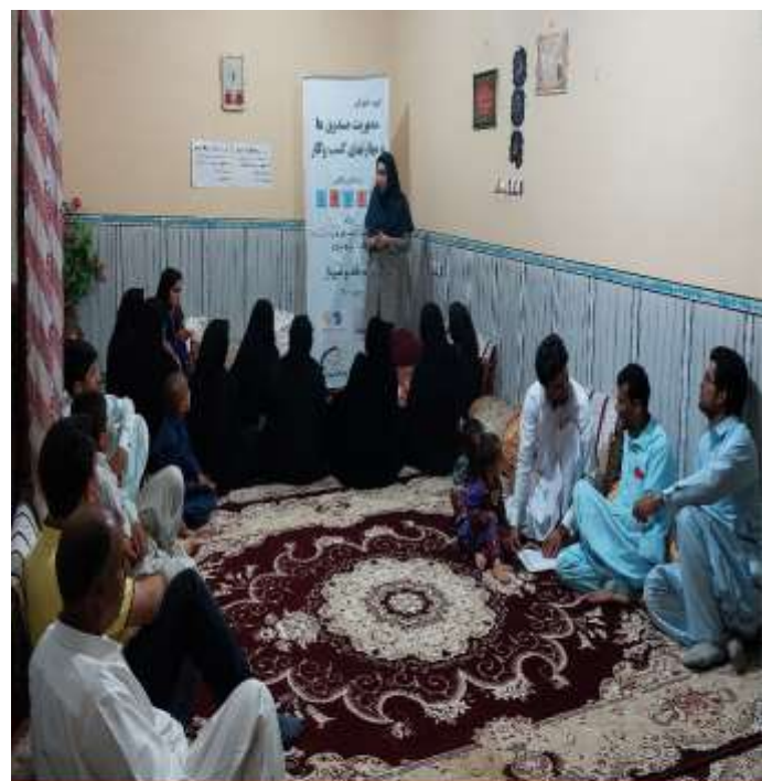
دوره آموزش مهارت‌های زندگی و کسب و کار بر اساس الگوی LNSIE اعضای صندوق های مالی خرد روستاهای کوازدر و محمدآباد سرپاز به صورت مشترک مهرماه 1401