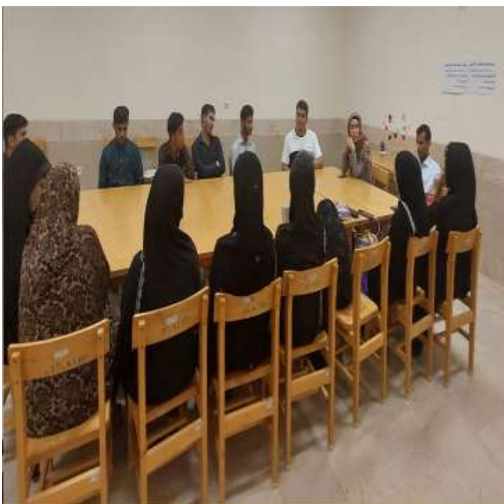
دوره آموزش مهارت‌های زندگی و کسب و کار با الگوی LNSIE اعضای صندوق های مالی خرد روستای ساریوک شهرستان قصرقند - مهرماه 1401