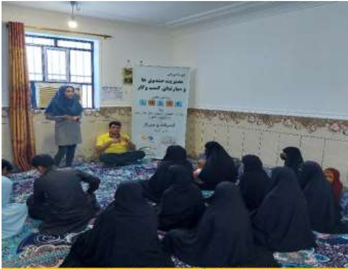
دوره آموزش مهارت‌های زندگی و کسب و کار بر اساس الگوی LNSIE اعضای صندوق مالی خرد روستای گوردز شهرستان سرپاز - مهرماه 1401