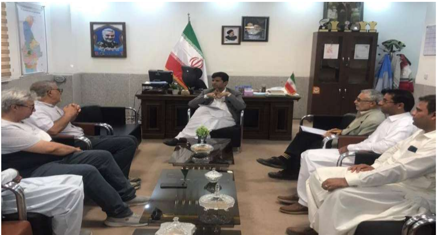
جلسه با فرماندار قصرقند