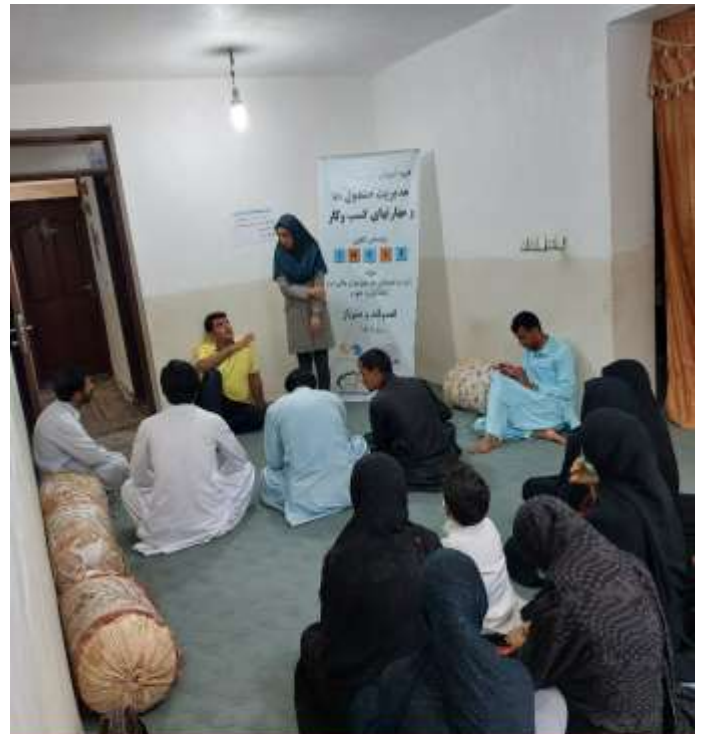
دوره آموزش مهارت‌های زندگی و کسب و کار بر اساس الگوی LNSIE اعضای صندوق مالی خرد روستای کوه‌میتک شهرستان سرپاز - مهرماه 1401