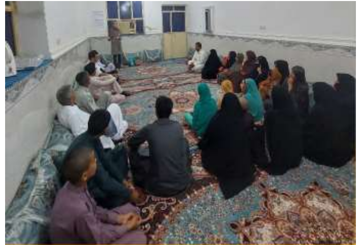
دوره آموزش مهارت‌های زندگی و کسب و کار بر اساس الگوی LNSIE اعضای صندوق مالی خرد روستای بگ شهرستان قصرقند - مهرماه 1401