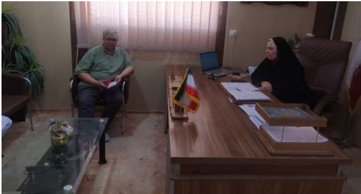
جلسه با بخشدار مرکزی شهرستان سرباز و بررسی مزیت های منطقه ای و روستاهای هدف شهریور 1401