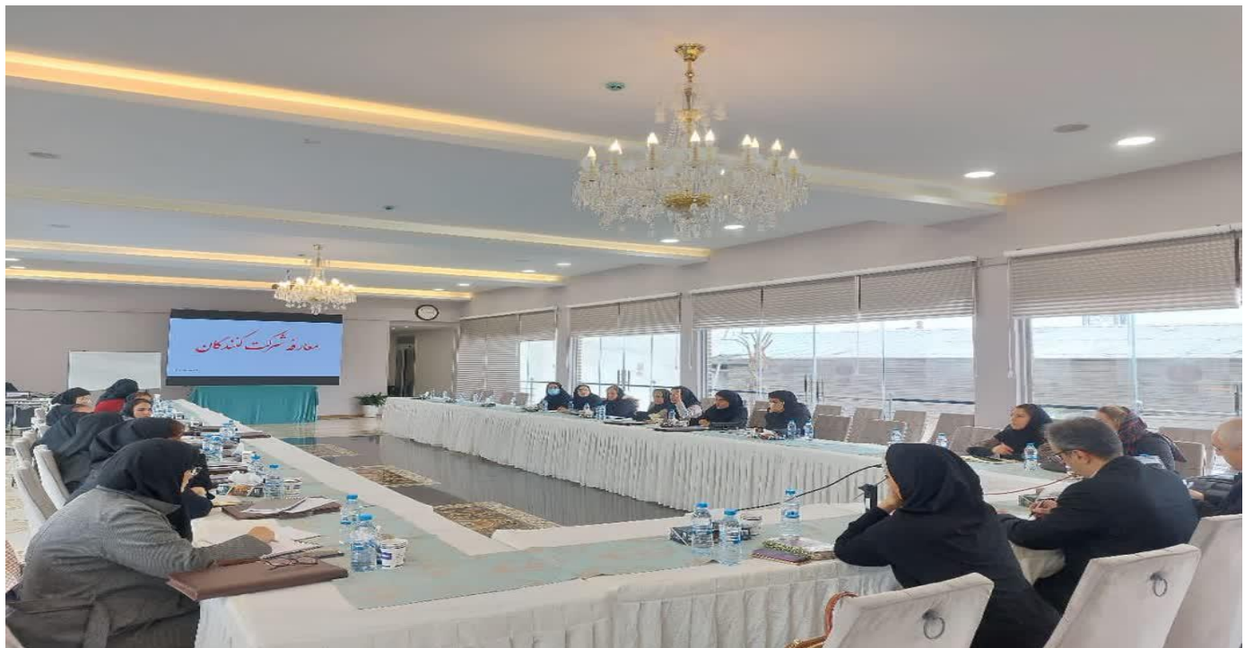
معارفه شرکت کنندگان بعد از مراسم افتتاحیه