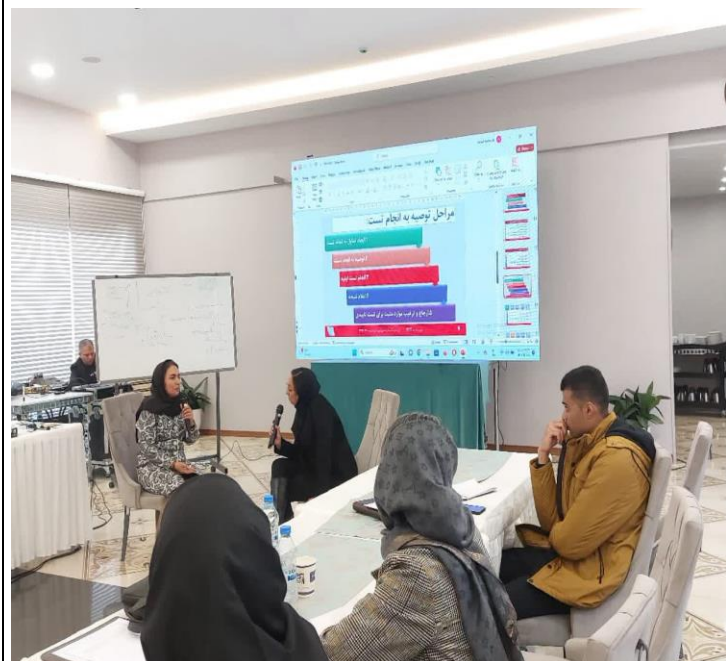
اجرای روش ایفای نقش در کارگاه روز اول