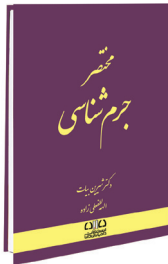
مختصر جرم شناسی