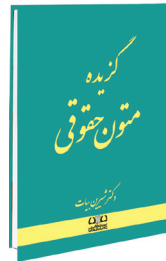
گزیده متون حقوقی