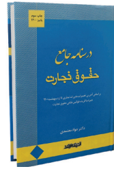
درسنامه جامع حقوق تجارت