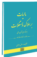
مالیات بر املاک و مستغلات