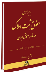
بايسته‌هاي حقوق ثبت املاک