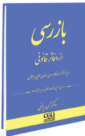
بازرسی از دفاتر قانونی