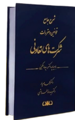
شرح جامع قوانین و مقررات